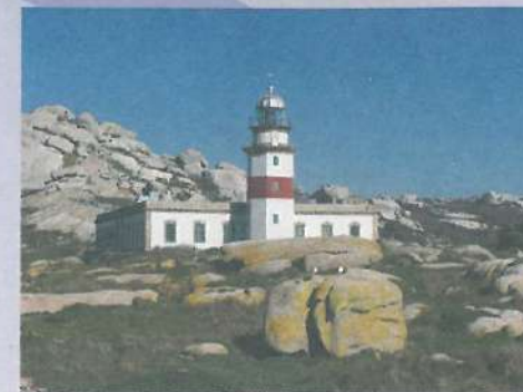
El faro fue inaugurado en 1921 tras el trágico naufragio del Santa Isabel.