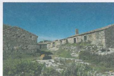
La antigua aldea de Sálvora, testigo de otro tiempo y otro modo de vida, yace ahora abandonada.