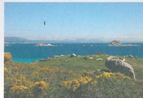
Los islotes que rodean el archipiélago son parte de las zonas de reserva que preservan su gran riqueza biológica.

Por el camino a la antigua aldea de Sálvora sólo podremos ir si nos acompañan guías autorizados por el Parque Nacional. Ellos nos irán indicando el recorrido y aquellos puntos donde debemos extremar las precauciones, por nuestra seguridad o por tratarse de lugares frágiles de gran interés para la conservación. De esta forma disfrutaremos de la visita sin causar daños a la naturaleza y al patrimonio.