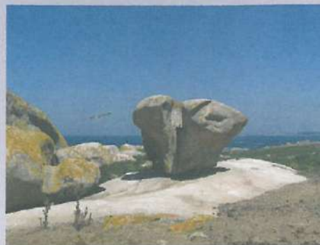
Los bolos, grandes rocas graníticas erosionadas por los vientos costeros, son típicos del paisaje de Sálvora.

El camino entre el muelle y el faro recorre la zona sur de la isla entre grandes bloques graníticos redondeados con curiosas formas. En esta ruta, salpicada de leyendas, varios carteles informativos nos irán descubriendo por qué hay una sirena en la playa-duna del Almacén, entre qué rocas gigantes se esconde la Santa Compañía y las historias de naufragios ante el faro. Volveremos al muelle por el mismo camino.